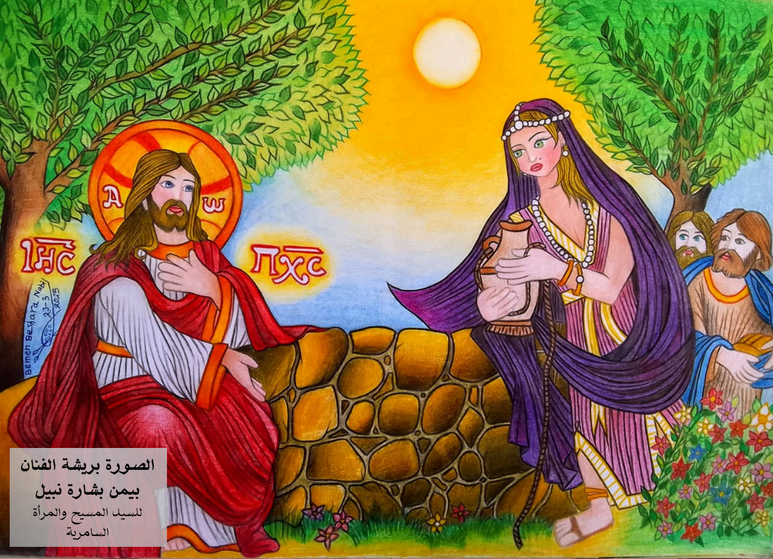
الصورة بريشة الفنان بيمن بشارة نبيل للسيد المسيح والمرأة السامرية