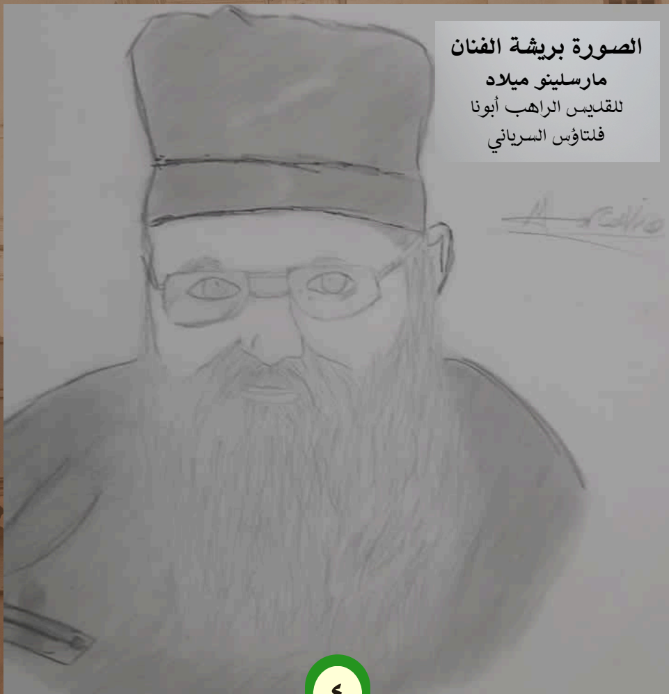
الصورة بريشة الفنان مارسلينو ميلاد للقديس الراهب أبونا فلتاؤس السرياني